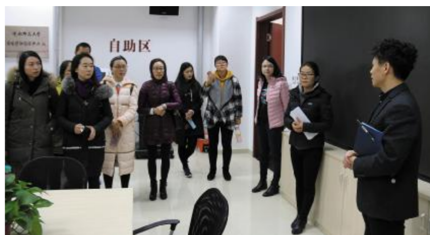
骨干教师参观首都师范大学一站式服务大厅

12月初,我校40名赴首都师范大学研修的骨干教师圆满完成培训返校。10天里,他们先后聆听了首师大专家学者围绕专业建设、本科培养方案、师范专业认证、交叉学科建设等方面内容开展的17场专题讲座,纷纷表示受益匪浅。本报特摘选部分参训教师学习心得,以展示他们首师大之行的收获。