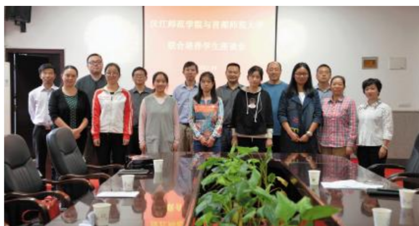
学校举行交流生进京求学欢迎会