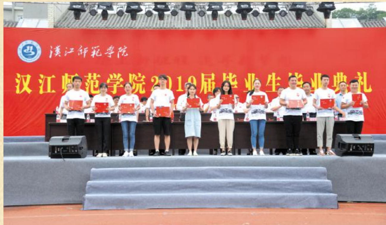
校领导为优秀毕业生颁发荣誉证书