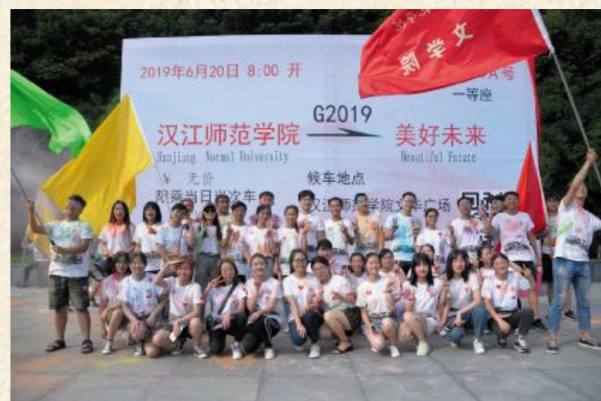
一起奔向更加美好的未来