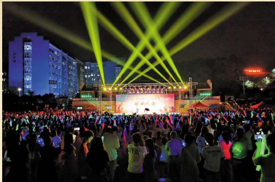
毕业晚会现场灯光璀璨