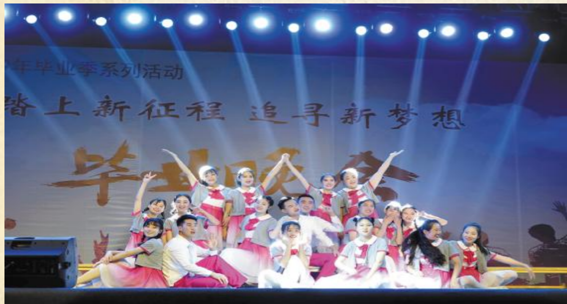
面向未来 笑靥如花