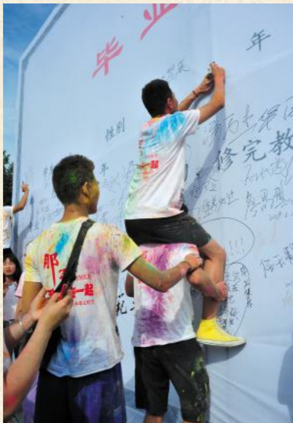
毕业生在毕业证墙上留言