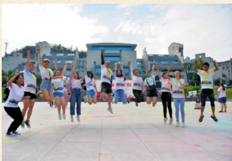
毕业啦,我们欢呼雀跃